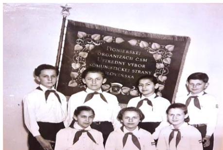
Fotografia č. 7: Fotografia pionierov pri Červenej zástave PO SZM