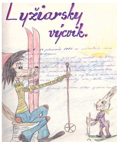
Obrázok č. 5: Záznam o konaní a priebehu lyžiarskeho výcviku doplnený ilustráciou zo sovietskej rozprávky Vlk a zajac

Na podporu tejto oblasti vznikali aj stanice mladých turistov, turistické základne a ubytovne, často ako súčasť domov pionierov a mládeže. Brannú výchovu obohatili každoročné celoštátne stretnutia najlepších mladých ochrancov hraníc a ďalšie aktivity, uskutočnené v spolupráci so Zväzarmom a ozbrojenými zložkami (O. Čmolík a kol., 1983). „Dňa 26. IV. sa žiaci našej školy zúčastnili súťaže o Partizánsky samopal. Súťažilo sa v týchto kategóriách: strelba zo vzduchovky, hod granátom na cieľ, šplh po vodorovnom lane, test z pravidiel cestnej premávky, zdravotnícka a protichemická príprava, orientačná práca s mapou a buzolou, protipožiarna ochrana“ (Kronika ZŠ v Cíferi, šk. rok 1976/77).