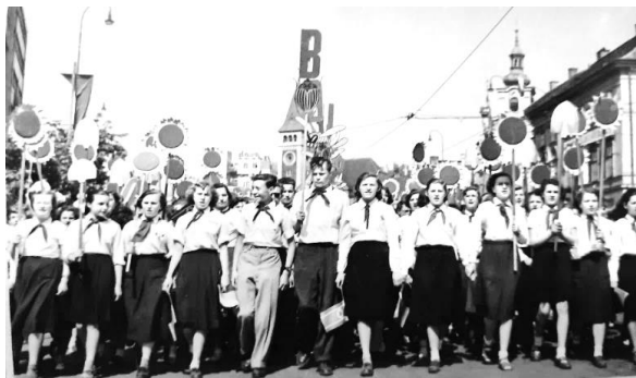
Fotografia č. 3: Prvomájový sprievod v roku 1954

nástrojom na budovanie komunistického vedomia boli oslavy sviatkov a pamätných dní, najmä tých, ktoré mali nejakú spojitosť s ideami komunistickej strany. „ Oslavoval sa aj 1. máj a Deň žien. To boli veľké oslavy “ (R10). „ Potom sme mali Deda Mráza. Oslavovali sme aj 1. a 9. máj. To boli také sprievody. Keď bolo SNP, tak k nám chodili partizáni. Rozprávali nám o bojoch a ukazovali pušky. Pri vatre hrali na harmonike a spievali partizánske pesničky “ (R6). „ Veľká októbrová socialistická revolúcia. Tak to sme museli v školách pripravovať vystúpenie “ (R9). „ A tiež sme mali slávnostné nástupy “ (R10). „ Vystupovali sme, pri tých všetkých sviatkoch, recitovali sme všelijaké básničky “ (R2). P. Zajac a kol. (2020) upozorňujú, že pre oslavy bola príznačná poetika rovnakosti, rovnošaty, rovnakého kroku, rovnakého pozdravu, rovnakých úkonov, pri ktorých jednotlivci splyva s masou, dokonca ich prirovnali k nacistickým manifestáciám.