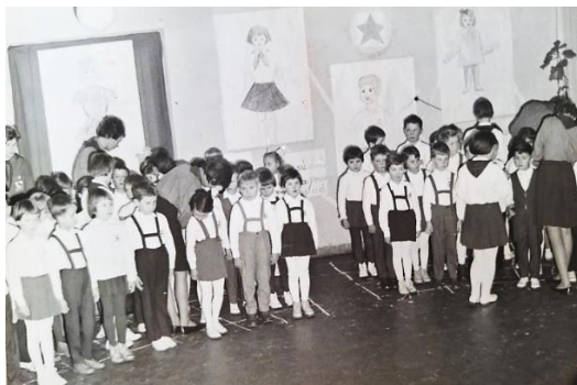
Fotografia č. 10: Sľub iskier

Zložením sľubu iskry dostali preukaz a boli označené odznakom iskier. Ten pri slávnostných príležitostiach nosili pripnutý na bielej košeli. Podobne ako pioniersky odznak, aj odznak iskier mal svoju symboliku. Vyjadroval príslušnosť k pionierskej organizácii. Tvorila ho otvorená kniha, ktorá predstavovala prvú povinnosť detí – usilovne sa učiť. Červená hviezda bola symbolom priateľov detí z celého sveta a tri plamienky v kruhu predstavovali spojenie troch generácií, ktoré idú za spoločným cieľom: komunistov, zväzákov, pionierov s iskrami (J. Svatošová, 1966).