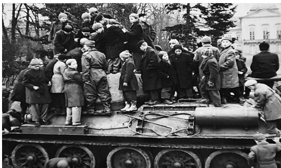
Fotografia č. 5: O bojovú techniku majú záujem väčší i menší.