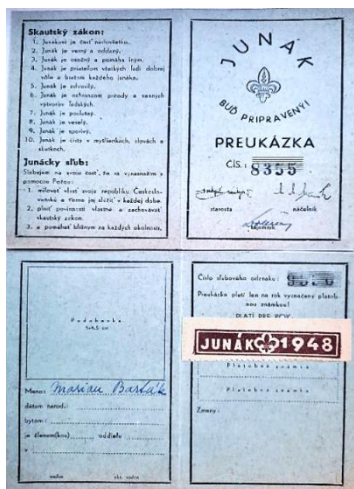
Obrázok č. 2: Preukaz Junáka obsahujúci skautský pozdrav, znak, zákon a sľub