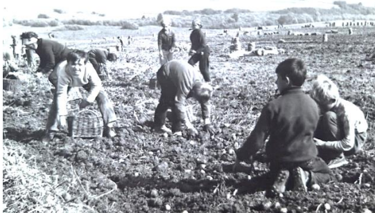
Fotografia č. 2: Zber zemiakov