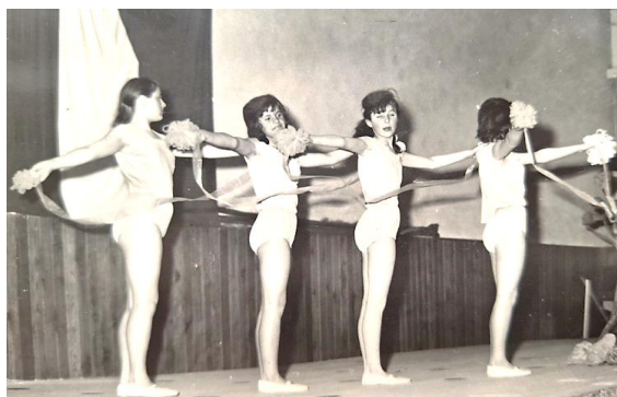
Fotografia č. 12: Nácviik spartakiády

v Abraháme (šk. rok 1984/85) nachádzame záznam, že na školách sa pred začiatkom spartakiády konalo „spartakiádne ohňové posolstvo. Aj naša škola sa zapojila. Určeného dňa (4. 10. 1984) sme mali prísť do školy o 17.30 v pionierskej rovnošate. Vošli sme do svojich tried a volili oddielovú radu. O 18.00 sa na stanici Hviezda začal príhovor k ohňovému posolstvu. Vtedy sme vyšli pred budovu školy a zapálili vatru. Keď sme si vypočuli príhovor, jednotlivé oddiely zaspievali piesne. Veľmi sa nám to páčilo.“ Aj to poukazuje na skutočnosť, že organizácii spartakiád sa venovala veľká pozornosť.