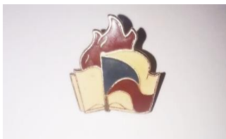
Fotografia č. 8: Pioniersky odznak