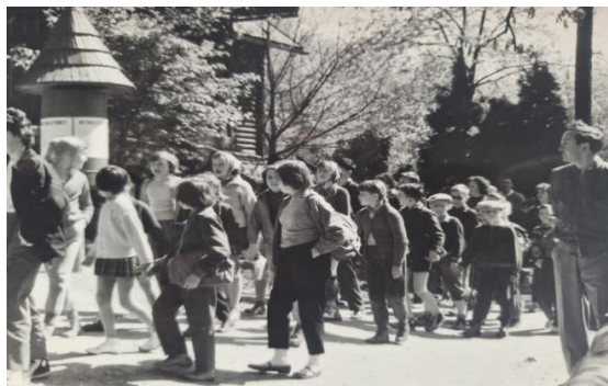
Fotografia č. 4: Nedeľný výlet pionierov usporiadaný turistickým krúžkom Domu pionierov a mládeže K. Gottwalda v Bratislave