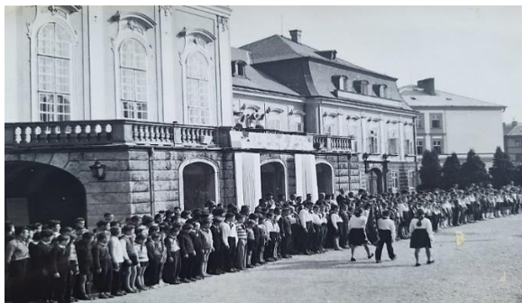
Fotografia č. 6: Zahájenie šk. roku 1961/62 v Pionierskom dome K. Gottwalda v Bratislave

v Bratislave 89 a v Prahe. Postupne sa zriadili aj v Piešťanoch, Banskej Bystrici a v Prešove, následne v Trnave, Vrútkach, Nitre, Košiciach a v Bratislave. Dom pionierov v Bratislave sa stal centrálnym. 90