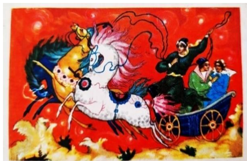
Obrázok č. 3: Kalendárík zo Sovietskeho zväzu na rok 1971