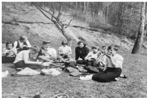
Fotografia č. 11: Výlet pionierskeho oddielu na Lachovec. 1971