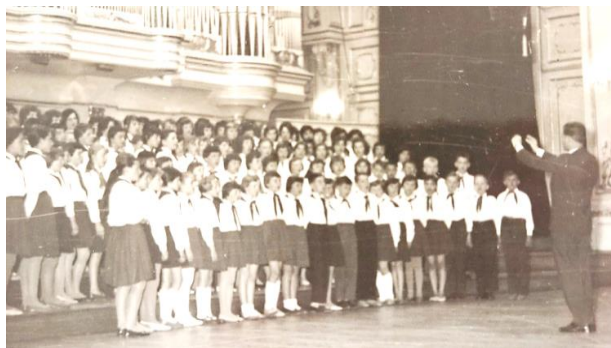
Fotografia č. 13: Spevácky zbor

Význam rôznych umeleckých záujmových útvarov spočíval aj v tom, že pripravovali kultúrny program pri rôznych slávnostiach a oslavách „ Oslavy 28. októbra a výročie Októbrovej revolúcie škola vyplnila hodnotným programom, zborový spev, recitácie, cvičenia s tyčami, tance “ (Kronika ZŠ v Lozorne, šk. rok 1949/50) a podieľali sa aj na tematickej výzdobe násteniek a školy, ako aj na výrobe drobných darčiekov, ktoré sa potom využívali pri rôznych stretnutiach.