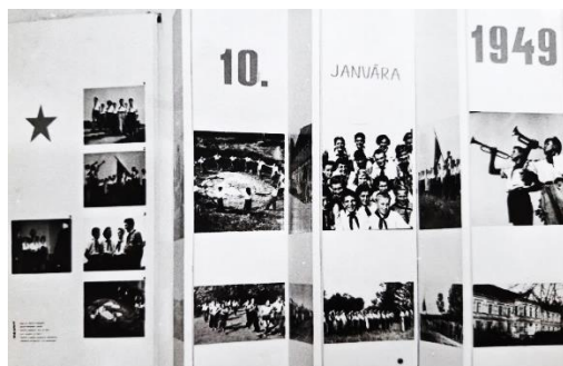
Fotografia č. 1: Založenie Pionierskej organizácie v Trávnici

činnosti. 66 Pionieri sa stali vzorom v školskej dochádzke a prospechu. Žiak, ktorý dosiahol v školskom roku výborný prospech, získal titul „vzorný žiak“ (tamže).