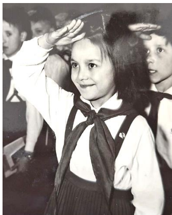
Fotografia č. 9: Pioniersky pozdrav

Pionierske heslo sprevádzal pozdrav pionierov . P. Martínek a kol. (1983, s. 98) popisujú ideologickú symboliku, ktorú v sebe pioniersky pozdrav niesol: „symbolizuje skutočnosť, že pionier kladie záujmy pracujúcich všetkých piatich svetadielov (päť pevne zomknutých prstov) nad svoje vlastné záujmy (ruka zdvihnutá nad čelom). Pionierskym pozdravom zdravili pionieri pri štátnej hymne, Internacionále, štátnu vlajku, historické revolučné prápory, zástavy ozbrojených zložiek, červenú zástavu Socialistického zväzu mládeže, vlády a ROH.“